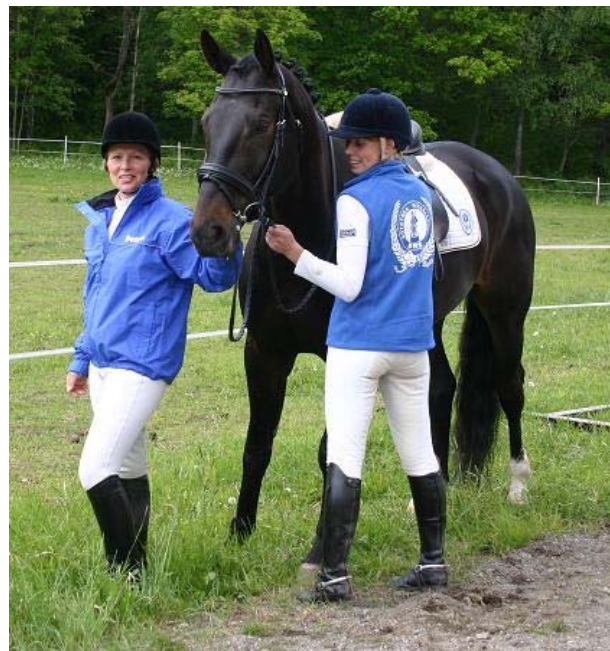
Enhetliga profilkläder hjälper till att tydliggöra och stärka vårt varumärke!

intressenter som kommande styrelser. Det är viktigt att en förening har en skriftlig historia att kunna gå tillbaka till.