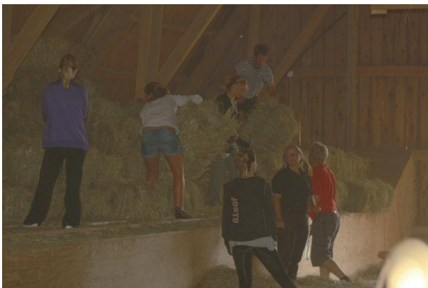
Årets höintag tog en lång dag i anspråk mot tidigare två.

BRS är som bekant en ideell förening som kräver många ideella timmar. Jag som verksamhetschef tycker att det värmer i hjärtat när man möts av många barn och ungdomar som lever sitt liv i stallet. Det präglar många barn till att ta ett vardagligt ansvar och man får en social kompetens då man redan som ung kommunicerar med människor i alla åldrar.