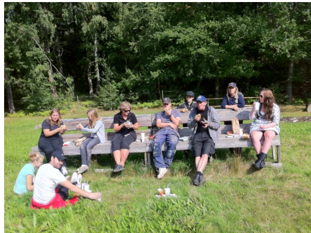
Ett arbetslag under välbehövlig vila efter en insats på terrängbanan.

Gräsbanan är jämn och fin med mycket gräs.