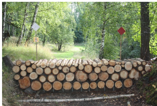
Även fälttävlansbanan har under året fått sig en rejäl genomgång. Övan stockhindret nere vid Torpet.

Alla stallar har på sedvanligt sätt tvättats med högtryck under sommaruppehållet samt målats.