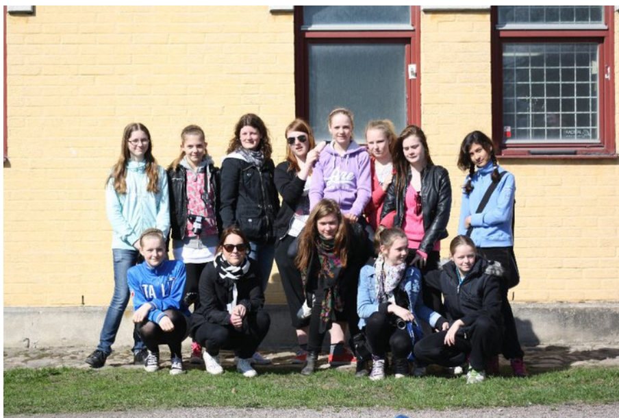
Glada ungdomar under besök på Flyinge.