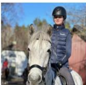
Moa- Vice ordförande